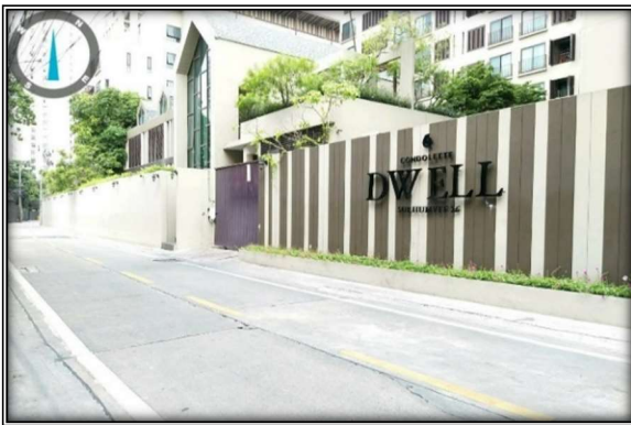
ด้านทิศเหนือของโครงการ : ติดบ้านพักอาศัย