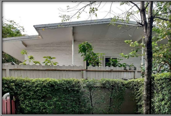
ด้านทิศเหนือของโครงการ : ติดบ้านพักอาศัย