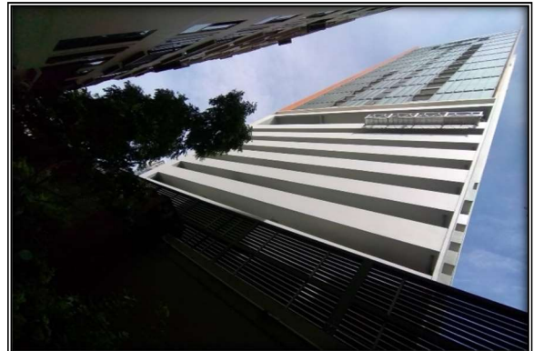
ด้านทิศตะวันออกของโครงการ : ติดกับบ้านพัก