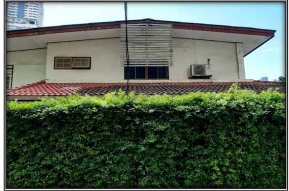
ด้านทิศตะวันออกของโครงการ : ติดกับบ้านพัก